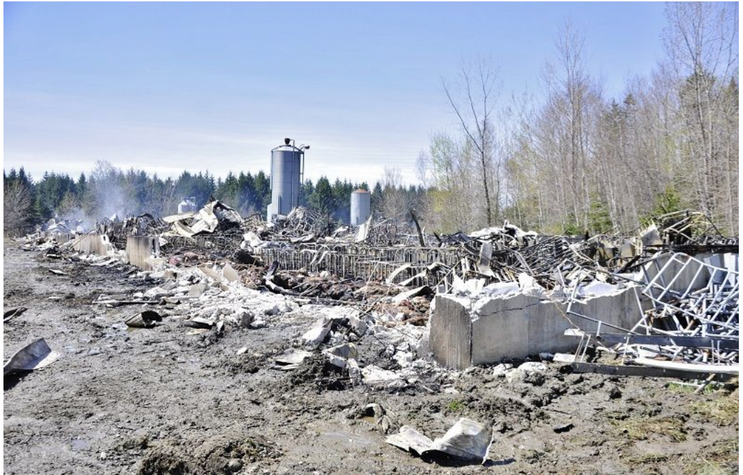
Photo : Plus de 2 000 porcs ont succombé au brasier hier soir alors que les flammes ont eu le dessus sur la porcherie de Barnston de l'entreprise Ferme Porcine M. V. inc.