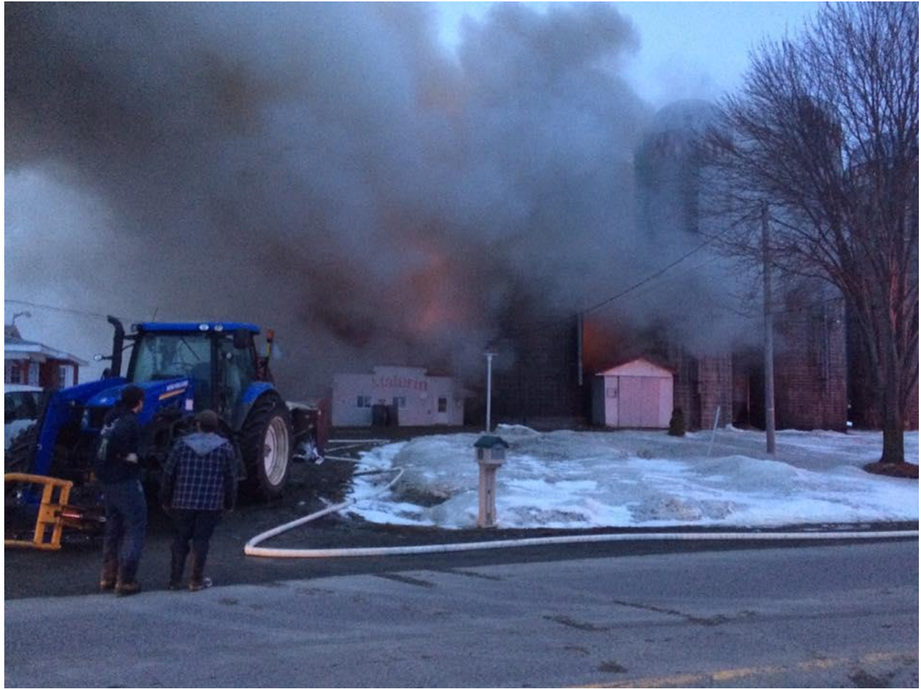
Info Énergie/Rouge FM

Une enquête tentera de faire la lumière sur ce qui a pu causer un incendie qui a complètement détruit la ferme Malurin située dans le rang St-Michel à St-Célestin.