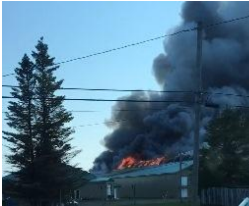
Incendie aux Oeufs Richard, le 29 juin 2018

Date de modification: vendredi 29 juin 2018 - 15h44