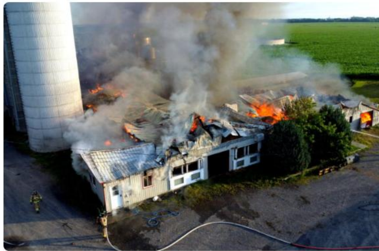
Un incendie majeur détruit une ferme laitière à Saint-Cyrille

In Faits divers , Incendie , Vidéos 3 juillet 2024 Éric Beaupré