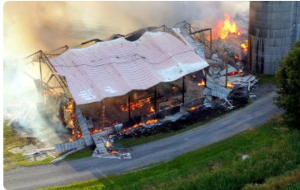
Un incendie majeur détruit une ferme laitière à Saint-Cyrille