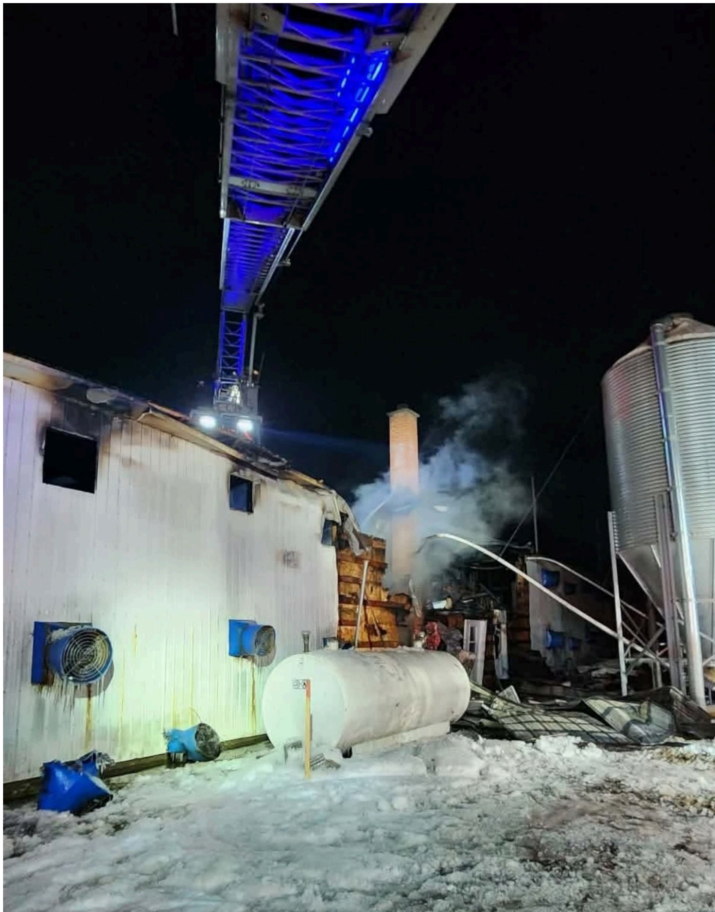
Cette intervention a nécessité l'implication de 45 pompiers provenant de divers services incendie. (Service incendie de Bromont)