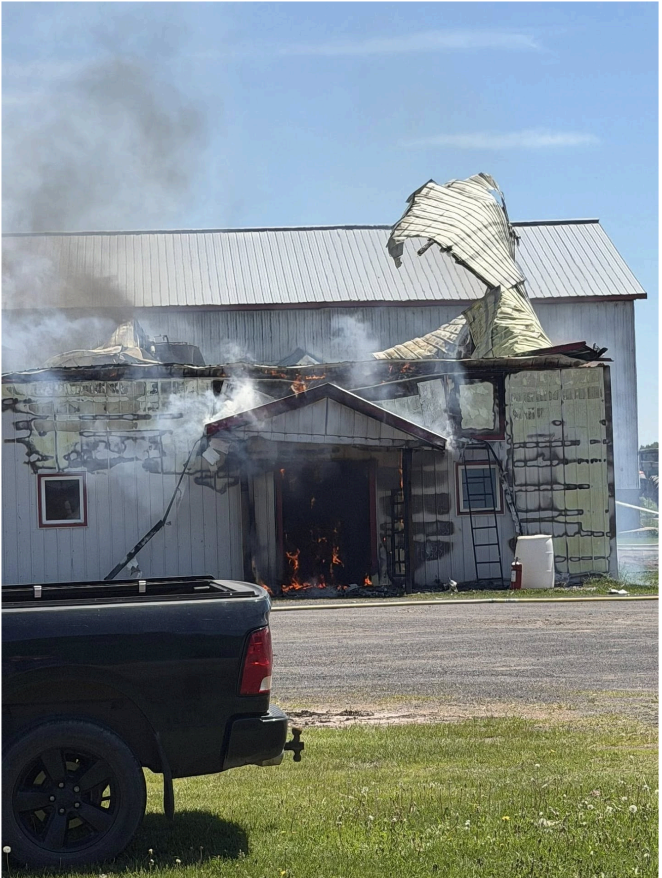
L'incendie s'est déclenché vers 13 h dans un bâtiment agricole situé sur le rang Marigot.